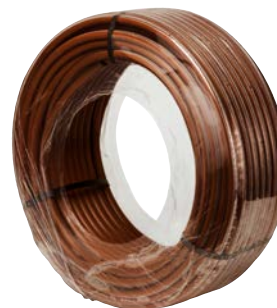
A csőtekercs műanyag fóliába csomagolva