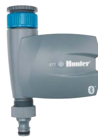
BTT-101 Diametro di ingresso: 3/4" e 1" Diametro di uscita: 3/4" Altezza: 16,8 cm Larghezza: 12 cm Profondità: 6 cm

Il termine e i logotipi Bluetooth® sono marchi registrati di proprietà di Bluetooth SIG Inc. e qualsiasi utilizzo di tali marchi da parte di Hunter Industries è concesso in licenza. iOS è un marchio o un marchio registrato di Cisco negli Stati Uniti e altri paesi ed è concesso in licenza. Android è un marchio registrato di Google LLC.