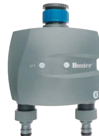
BTT-201 Diametro di ingresso: 3/4" e 1" Diametro di uscita: 3/4" Altezza: 15,7 cm Larghezza: 13,5 cm Profondità: 7,6 cm