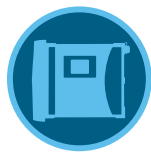
وحدة التحكم HCC