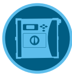
وحدة تحكم ICC2