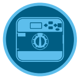
وحدة التحكم Pro-C