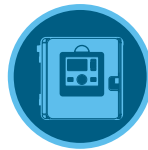
وحدات تحكم ACC2