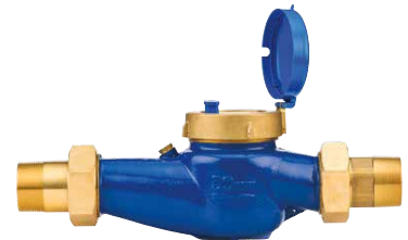
Medidor de Caudal HC Incorpore un medidor de caudal opcional para recibir alertas sobre el caudal y monitorear el consumo de agua