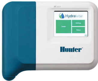
Controlador HC 6 y 12 estaciones

Aprobado como WaterSense por la EPA Reconocido como una herramienta efectiva para el ahorro de agua por la Agencia de Protección Ambiental de USA.