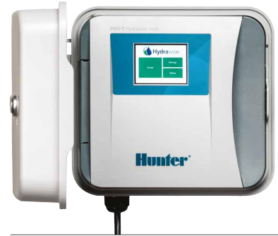
Controlador HPC 4 a 16 estaciones