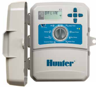
Controlador X2 con Módulo WAND 4, 6, 8 y 14 estaciones