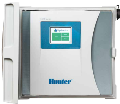
Controlador HCC 8 a 54 estaciones con opción de sistema de decodificadores EZ (EZDS) de dos cables