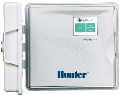
Controlador Pro-HC 6, 12 y 24 estaciones