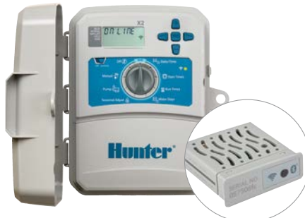
Sterownik X2 z modułem WAND Liczba sekcji: 4, 6, 8 i 14