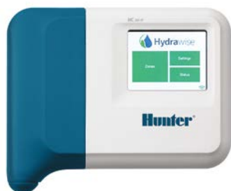
Sterownik HC Liczba sekcji: 6 i 12

Sprawdzone i niezawodne narzędzie do oszczędzania wody