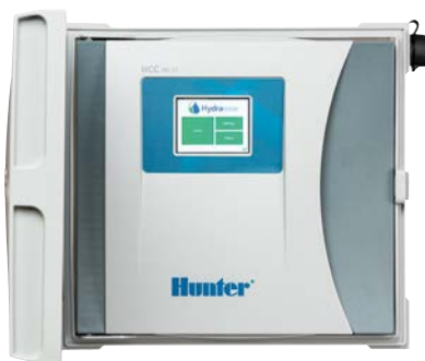
Sterownik HC Od 8 do 54 sekcji, opcja dwuprzewodowa EZDS