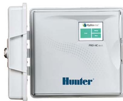
Sterownik Pro-HC Liczba sekcji: 6, 12 i 24