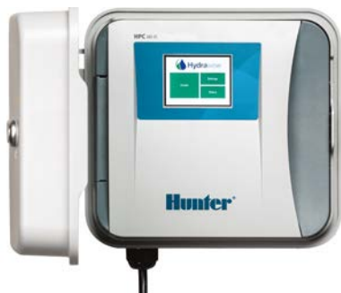
Sterownik HPC Od 4 do 32 sekcji, opcja dwuprzewodowa EZDS