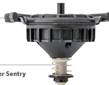
Механизм Filter Sentry