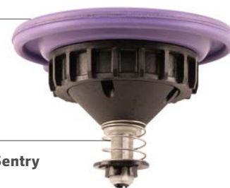
Механизм Filter Sentry

Диафрагма с двойным бортиком, устойчивая к воздействию хлора