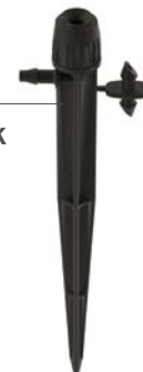
HS-B-STK Hauteur : 15,2 cm