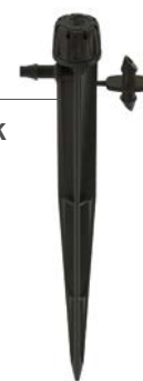
SD-B-STK Hauteur : 15,2 cm