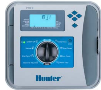
塑料，室外型 高：22.9 cm 宽：25.4 cm 厚：11.4 cm