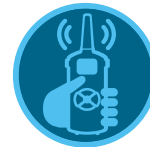
ROAM 遥控器 ROAM XL 遥控器