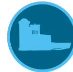
Solar Sync 传感器