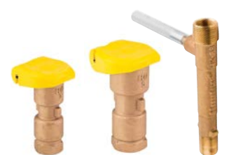
HQ-3-RC HQ-5-RC HK-33