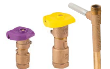
HQ-33-DLRC-R HQ-44-LRC HK-44