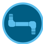
Raccords articulés SJ