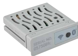
Módulo WAND Wi-Fi

Altura: 2 cm Largura: 5 cm Profundidade: 5 cm