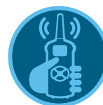
Controle remoto ROAM