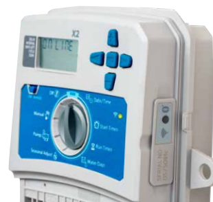
Módulo WAND instalado no controlador X2

Altura: 2 cm Largura: 5 cm Profundidade: 5 cm